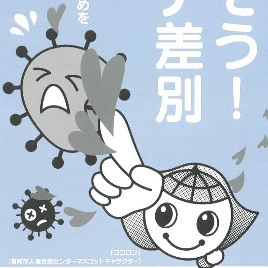
「ココロン」 (福岡市人権啓発センターマスコットキャラクター)

なくそう！ コロナ差別 冷静な行動、助け合い、 支え合いの力で 不当な差別・偏見・いじめを なくしましょう。