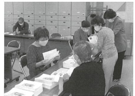
感染予防しながらカレンダー作成

片江人尊協の根幹をなす活動として、町別人権研修会に力を入れて取り組んできました。14町内全てで実施することは確かに大変ですが、「なかなか研修する機会がないのでよい機会だった。」「またやって欲しい。」という感想をもらうことが多く、今後も大切に続けていきたいと思っています。