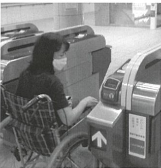
地下鉄七隈駅での取材

毎年作成している人権カレンダーは、使いやすい大きさということもあり、地域の皆様に大変好評です。昨年度は、片江小学校6年生から募集した標語と絵手紙の2つの公民館サークルの作品とを組み合わせ、片江校区ならではの手作りカレンダーを作成しました。片江小学校と片江中学校、校区住民、城南区人尊協関係者に配付することで、多くの家庭でカレンダーを通しての人権啓発が行われています。