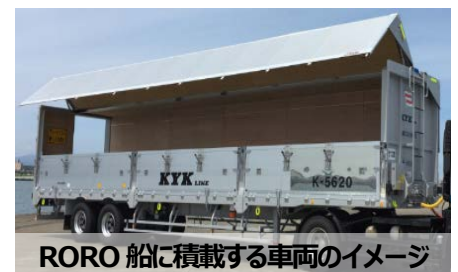
RORO 船に積載する車両のイメージ