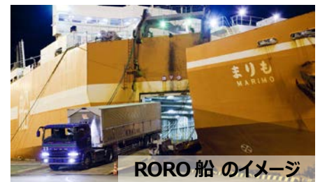
RORO 船 のイメージ