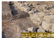
出土した石積み遺構