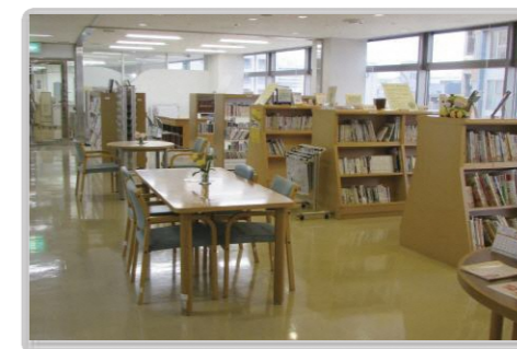
●図書等閲覧室 人権についての図書、資料やビデオの閲覧、貸出を行っています。貸出は図書5冊、ビデオ・DVD2本まで、2週間以内です。貸出には利用者カードが必要です。運転免許証など住所、氏名の確認ができるものをお持ち下さい。