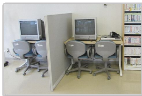
●ビデオ・DVD視聴コーナー ビデオ・DVDの視聴ができます。