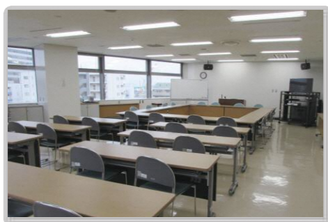
●研修室 / 利用人数60人(スクール形式) 利用登録団体が、人権問題に関する研修会や 会議などを行う時に利用できます。

当センターはだれでも自由に利用できます。(無料) ただし、研修室および交流室の利用については、 団体の利用登録と予約(3か月前から受付可)が必要です。 ※団体の利用登録手続きなどについては事務室にお尋ねください。