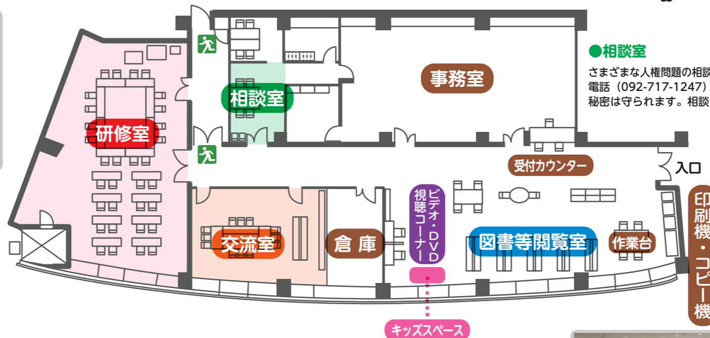
●相談室 さまざまな人権問題の相談をお受けしています。 電話(092-717-1247)もしくは面談です。 秘密は守られます。相談は無料です。