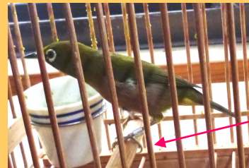
飼養登録を受けたメジロ