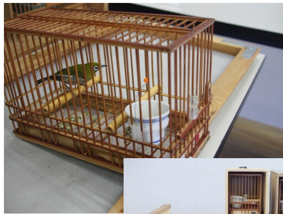
警察に押収されたメジロ