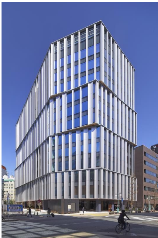
筑紫口中央通り(西側)から

本ビルは、福岡県の敷地を有効活用するとともに、福岡市において官民連携で推進する「博多コネクティッド」(※1)をはじめ福岡市のプロジェクトである「都心の森1万本プロジェクト」(※2)「Fukuoka Art Next」(※3)にも参画し、博多駅周辺のまちづくりの一役を担ってまいります。