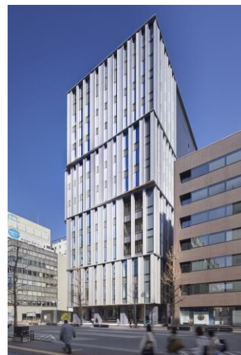
筑紫口中央通り(東側)から