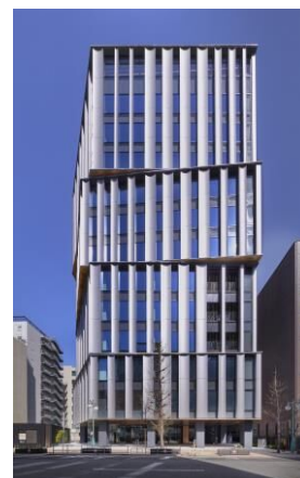
筑紫口中央通り(正面)から

「デンマーク王立図書館」をはじめ世界で多くの実績を持つ建築デザイン事務所「シュミット・ハマー・ラッセン・アーキテクト」（デンマーク）によるデザインです。3層毎に分節し、周囲に対して様々な角度で向き合うことで周囲のまちなみと調和します。縦基調のラインは景観にリズムを与え、とともに、筑紫口エリアの成長と発展を象徴します。