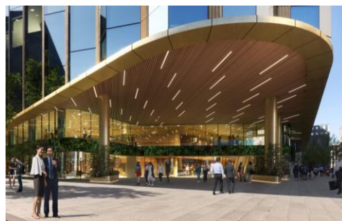
「コネクティッドコア」地上広場イメージ

敷地北東側に地上・地下の歩行者ネットワークの核となる大規模立体広場「コネクティッドコア」を整備し、博多駅から住吉通りやはかた駅前通りへの回遊性向上に繋がります。また、博多まちづくり推進協議会等による様々なイベント利用に対応し、博多駅前の賑わいの広がりを創出します。