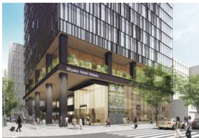
【外観イメージ (低層部)】