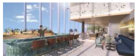
レストラン&バー (イメージ)

「光あふれるレストラン」をテーマに、朝食からランチ、ディナー、バータイムまでお楽しみいただけるオールデイダイニング。天井まで届くガラス張りの窓が開放的な印象を演出します。