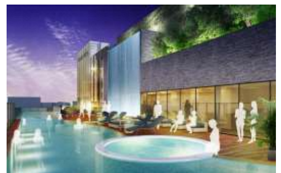
屋上温泉スパ (イメージ)

最上階の天然温泉を用いたスパエリアにはプールやジェットバス、足湯のほか、内湯とサウナも完備。ご宿泊のお客さまは専用のエレベーターでアクセスでき、無料でご利用いただけます。また、プールサイドでは、軽食やドリンクもお楽しみいただけます。