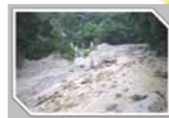
風致公園近くで発生した土石流 (2010.7)