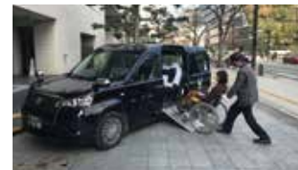
ユニバーサルデザイン(UD)タクシー ※当日会場に展示します

主催：福岡市 問合せ/ユニバーサル都市・福岡運営事務局(ラフェテム国際放送株式会社内) TEL:092-734-5462