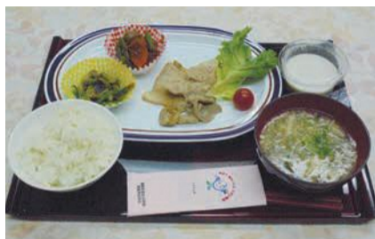
昨年のヘルシーランチ

《お口の水分測定》 口の渇き具合から健康状態をチェックします。歯科医師が改善のためのアドバイスや相談に応じます(先着50人)。