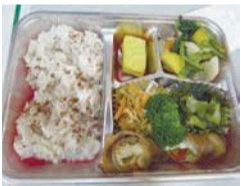
毎年人気の弁当(昨年)

「元気印いきいき弁当」や手作り焼き菓子、雑貨を販売します。※弁当は同日午前9時半から1食300円で食券を販売(先着120食)。