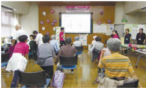
体操で筋力低下を防ぎます(ロコモ予防)

「みんなで学ぼう!ロコモ予防で健康づくり」をテーマに開催します。入場は無料です。内容は、区ホームページ(「東区健康フェスティバル」で検索)にも掲載しています。☎10月19日(金)午前9時半~午後0時半☎区保健福祉センター(保健所) ※公共交通機関をご利用ください。