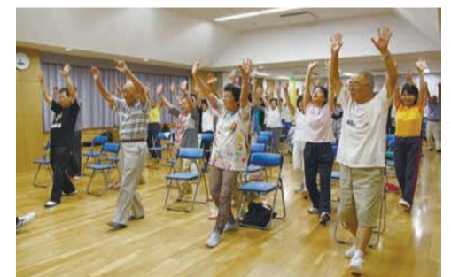
元気と笑顔いっぱい教室

すると「ポイントもらえます。血圧測定から始まり、香椎原病院の健康運動指導士の指導で、手足を動かしたり、ストレッチをしたりして、楽しく汗を流しました。参加者は「ポイントがもらえるのでやりがいがあり、特典が自分へのご褒美になる」「自宅でもスクワットをするなど健康への意識が変わった」「参加することで知り合え、声掛けあうことが増えた」と笑顔でした。