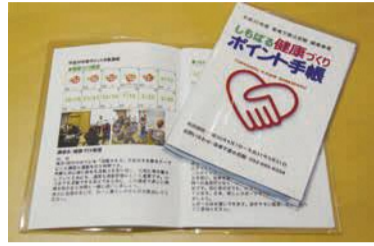
公民館手作りの「しもばる健康づくりポイント手帳」

医師の講演や健康チェック、体力測定、血管年齢測定などを行います。☎10月26日(金)午後1時~3時半☎☎原土井病院(青葉六丁目) ☎691-3881 ☎691-1059