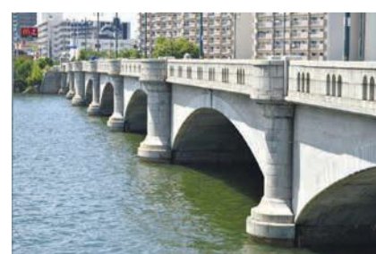
特徴である優美なデザイン

の設計で、昭和8(1933)年に完成しました。しかし、白く目立つ外観ゆえに、戦時中は爆撃の標的になる恐れがあるため、コーラルで黒く塗られ、照明灯も取り外されました。やがて人々の生活が安定するとコーラルは剥がされ、白い姿を取り戻しました。平成6年に「還暦」を迎えた名島橋は、昭和8年の完成当時の姿に改修されました。地域のシンボルとして美しい姿を保存しようとして、現在も地域のボランティアによって