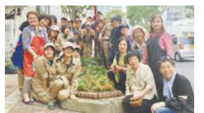
花づくりを続けることで国体道路のごみや放置自転車が減りました

中央区の警固交差点から、けご病院周辺までの歩道で、花づくり活動をしています。活動も今年で7年目。ボランティアや地域の皆さんと一緒に花を植え続けています。市造園建設業協会と市との合同チームで、9月14日(金)から山口市で開催の「山口ゆめ花博」にも花壇を出展します。