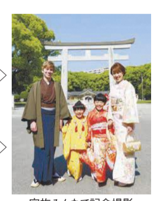
家族みんなで記念撮影

■問い合わせ先/ 福岡城 舞遊の館 ☎707-3191 ☎707-3193 開午前10時～午後4時 休月曜(祝休日)の場合は翌平日