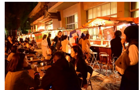
博多ライトアップウォーク2017屋台イベントの様子