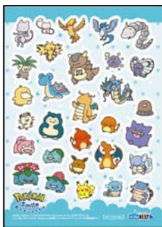
歯みがきできたねシール