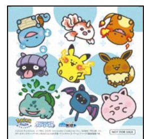
スペシャルステッカー

※健診は令和3年1月中旬～3月末まで実施 ※対象歯科医院は、健診開始までに、市ホームページ上でお知らせします。