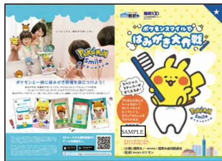
シール台紙（表紙・中面）