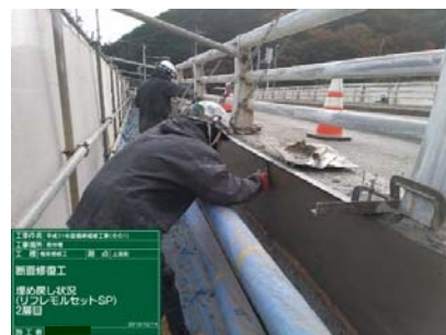
⑤【コンクリート復旧】