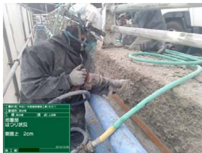
②【コンクリートはつり】