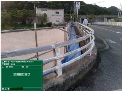
①【コンクリート・防護柵の劣化】

①写真のように橋の側面のコンクリート表面が劣化し、防護柵に錆びが発生していましたので②写真のようにコンクリート表面をはつり、③写真のように清掃した後、④・⑤写真のように復旧しました。