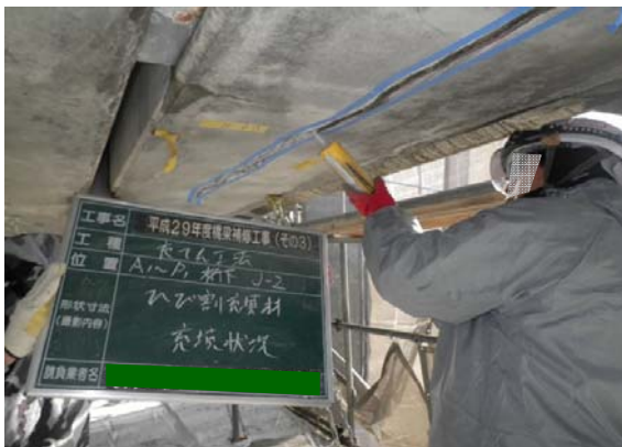
【修繕中】橋桁のひび割れ充填