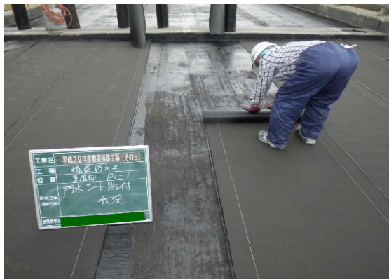
【修繕中】橋の表面に防水シートを設置

橋桁の下面に、ひび割れが発生していましたので、左上写真のようにシーリング材を充填して、ひび割れを補修しました。 右上写真の灰色の部分が補修した箇所です。