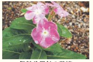
舞鶴公民館の花壇

区の人口 198,563人 (前月比 88人減) (男 88,658人 女 109,905人) 世帯数 121,583世帯 (前月比 87世帯減) (平成30年10月1日現在推計)