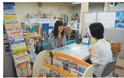
区役所 2階の相談窓口