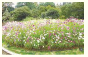
福岡市植物園のコスモス

区の人口 198,651 人 (前月比 41 人増) (男 88,752 人 女 109,899 人) 世帯数 121,670 世帯 (前月比 95 世帯増) (平成30年9月1日現在推計)