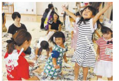
木曜日「わいわいタイム」(あいくる)