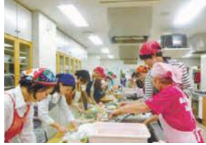
ヘルスマイトによる料理教室

お住まいの校区・地区の健康づくりを推進する食生活改善推進員(ヘルスマイト)の養成教室を開催します。健康づくりの基本や栄養の基礎などを学びます。期6月6日～7月25日の毎週水曜日。午前9時半～午後0時10分(終了時間は変更になることがあります)所あいいふ7階(舞鶴二丁目)区区内に住む人定先着40人料無料申区健康課 ☎761-7340 印734-1690