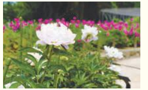
舞鶴公園のシャクヤク

区の人口 197,693人 (前月比233人増) (男88,066人 女109,627人) 世帯数 120,672世帯 (前月比634世帯増) (平成30年4月1日現在推計)