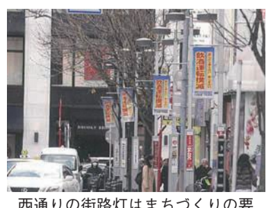
西通りの街路灯はまちづくりの要

天神から薬院への近道として徐々に交通量が増えていきました。明るい通りを目指して水銀街路灯を設置し、この街路灯の管理をするために