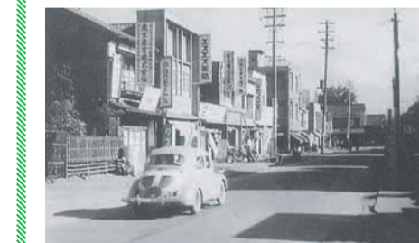
昭和30年代の天神西通り

昭和40年代、西通りは「安全、安心で明るく楽しい街づくり」に向け、「環境モデルの街宣言」を掲げて清掃活動に力を入れています。また、地域団体や警察等と一緒に夜間安全パトロールを行うなど、地域の人が安心して暮らすための取り組みを行っています。 (市地域産業支援課)