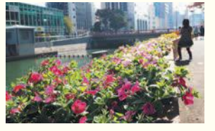
水上公園近くの川沿い花壇

区の人口 198,839人 (前月比 276人増) (男 88,800人 女 110,039人) 世帯数 121,762世帯 (前月比 179世帯増) (平成30年11月1日現在推計)