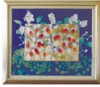
会長賞 日本画部門「夏の終わり」

「中央区美術作品展」に一般の部73点、小・中学生の部657点の作品が寄せられました。11月8日～13日に福岡各部門の上位受賞者は表彰式を行いました。