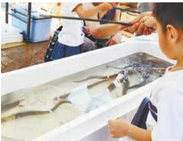
そっと針を垂らします

中でも親子連れに人気だったのが今回初開催となった「あなご釣り大会」です。玄界島漁業組合の協力を得て実現したこの企画は、平成17年の福岡県西方沖地震で被災した玄界島の住民が、同広場に設置された仮設住宅で生活した縁で開催されました。釣り上げられて元気に跳ねるアナゴに大きな歓声が上がっていました。