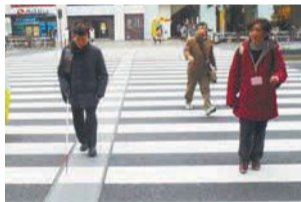
エスコートゾーン

誰もが安全で快適にまちを歩けるように、歩道の段差解消や横断歩道内へのエスコートゾーンの設置、小学校周辺の安全対策など、ユニバーサルデザインに基づいた道路整備を進めます。