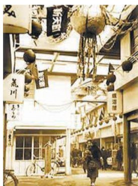
昭和25年頃の新天地