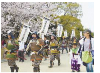
黒田二十五騎武者行列

「福岡城さくらまつり」の期間中、「福岡城・鴻臚館まつり」として地域と共働で福岡城や鴻臚館にちなんだ舞台や武者行列を行い、にぎわいづくりと歴史・文化の継承に取り組みます。