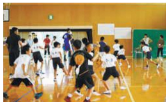
笹丘 子どもスポーツ教室

公民館とさまざまな専門性を持つNPOなどが共働で事業を実施し、魅力的な公民館事業(公民館じょいんとプロジェクト)を展開します。