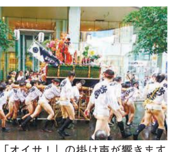
子どもたちの「オイサ！」の掛け声が響きます

鶏肉の生食はやめましょう 鶏刺しや鶏たたきなどが原因で食中毒が起きています。生肉には鮮度にかかわらずカンピロバクターやサルモネラなどの食中毒菌が付いていることがあります。区衛生課 ☎761-7356 ㊟761-8280