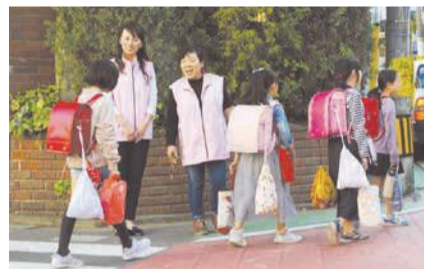
ピンクのベストが平尾校区民生委員の目印