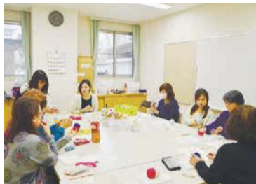
羊毛フェルト教室

毎月各世帯に配布される「公民館だより」は、校区・地区の公民館の講座や自治協議会(下記)の「舞鶴公園散歩学」講座は60代から80代まで14代まで9人が参加。かわいいいマスコットを作りま