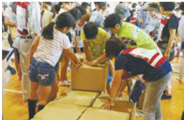
高宮校区自治協議会と高宮小学校の合同避難所運営訓練(平成29年9月)

自治協議会(※)は小学校区・地区ごとに、区域内の自治会・町内会やさまざまな分野(防災・防犯、体育振興、健康づくり他)で活動する団体で構成され、地域の皆さんが運営しています。お住まいの地域の自治協議会については、区地域支援課にお問い合わせください。