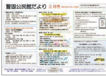
公民館だより(写真は警固公民館)

住所地で行われる選挙で投票するためには、住民票を移した後に3か月経過し、住所地の「選挙人名簿」に登録される必要があります。引っ越しをしたら忘れずに住民票を移しましょう。 区選挙管理委員会 ☎718-1007 ☎714-2141