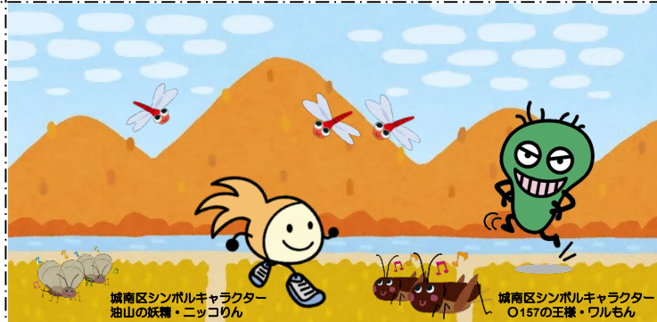
城南区シンボルキャラクター 油山の妖精・ニッコりん