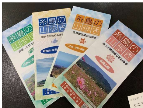
登山マップ「糸島の山歩き」

ぜひ、糸島市を訪れ、今回ご紹介した登山マップ等を片手に、楽しく健康づくりに取り組んでください。