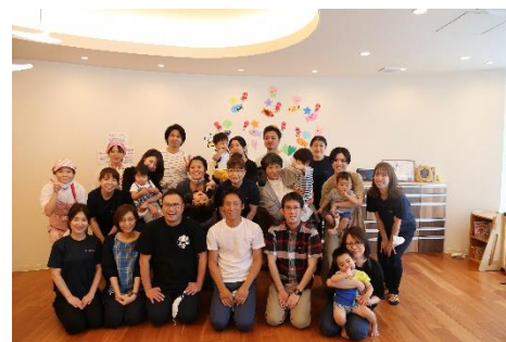
▲オズランド保育園～給食参観～