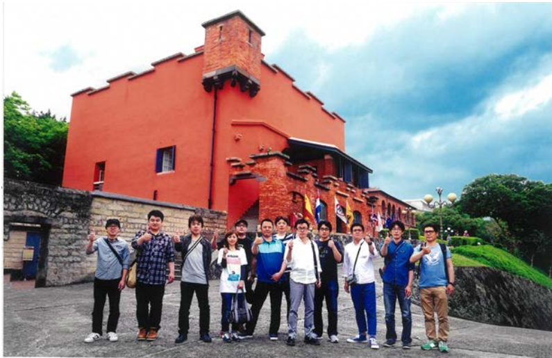
▲2019年4月 社員旅行 台湾

弊社は、1982年創業で第38期をおかげさまで迎えました。福岡市内を中心に主に官公庁発注の電気設備工事を行って、お客様に安心・信頼されることを目指し満足願える仕事をして参りました。現在、「少子高齢化にともなう生産年齢人口の減少」「育児や介護との両立、働く人のニーズの多様化」などの問題に直面しています。こうした中で働く機会の拡大や意欲・能力を存分に発揮できる仕事環境を作ることが、一人一人の事情に応じた働き方（ライフスタイル）ができ、社員一丸となって生産性向上との両立が実現できるように「働き方改革」のもと、積極的に推進していきたいと思ひます。