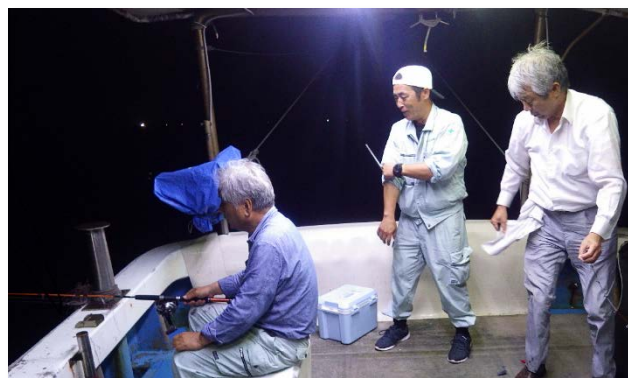
▲社員一同でイカ釣りを実施