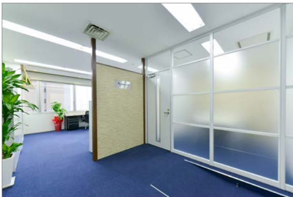
整理収納や動線を効率化したオフィス

これからも不動産業界の働き方改革を牽引できるよう、社員と力を合わせて精進していく所存です。