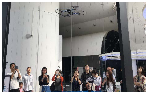
海外視察：深圳（ドローン体験）