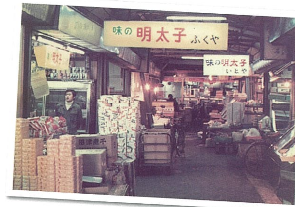
昭和50(1975)年の中洲市場内の様子

早良区男女共同参画をすすめる会は、下記の宣言を校区活動の指標とし、「校区活動に男女共同参画の視点をもたらすこと」を目指して活動しています。