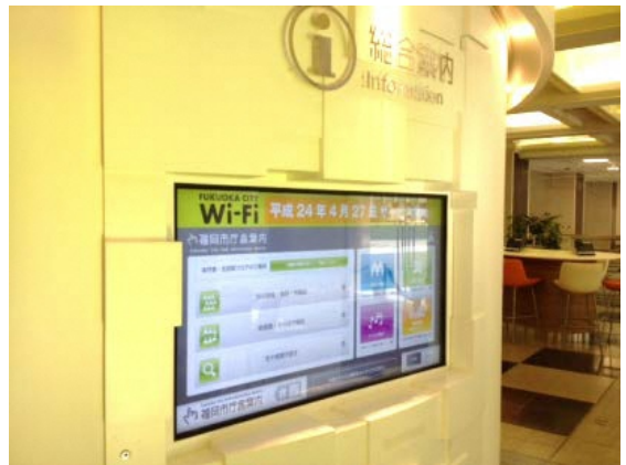
庁舎案内サイネージ