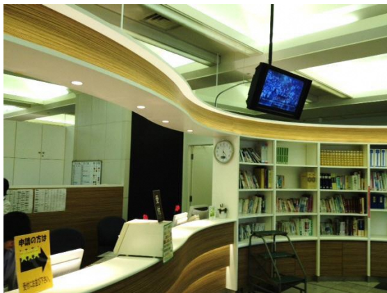
証明サービスコーナーサイネージ