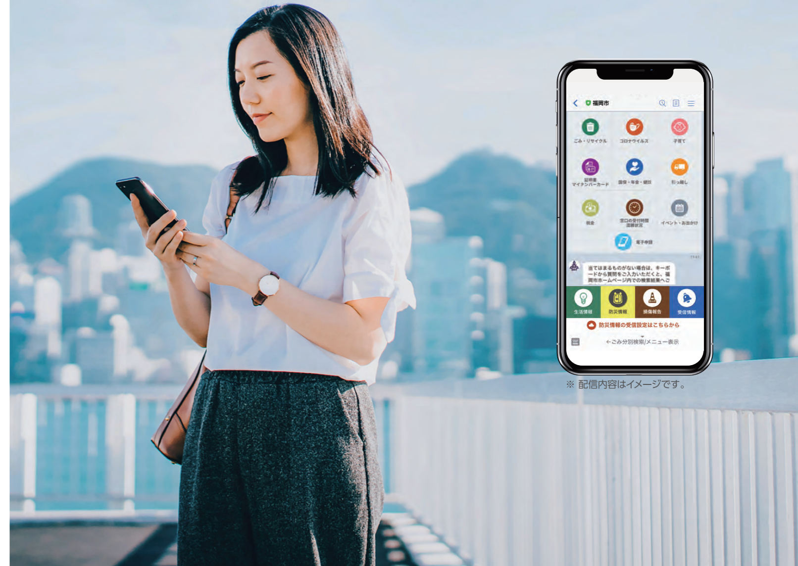
※ 配信内容はイメージです。