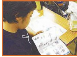
油山市民の森「おとな自然講座」野鳥編