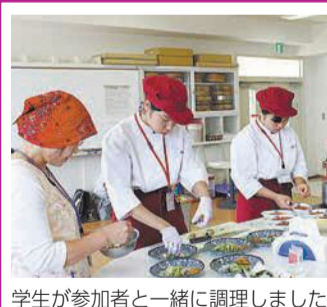
学生が参加者と一緒に調理しました

いずれか1点(顔写真付きのもの)▷運転免許証▷旅券(パスポート)▷住民基本台帳カード▷身体障がい者手帳、療育手帳▷その他官公署発行の顔写真付きの資格証明書 いずれか2点以上(顔写真付きでないもの)▷健康保険または介護保険の被保険者証▷各種年金手帳▷医療受給者証▷児童扶養手当証書▷その他社員証、学生証、通帳など