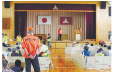
「避難所内には通路を作る」など運営のポイントを学びました

れ、段ボールベッドの作成や支援物資の搬入訓練を行い、避難所運営を体験しました。参加者は「段ボールベッドは簡単に作