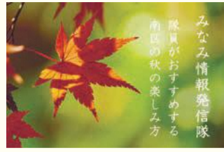
隊員がおすすめする南区の秋の楽しみ方