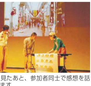
寸劇を見たあと、参加者同士で感想を話し合います

11月3～9日は市男女共同参画週間「みんなで参画ウィーク」です。性別にかかわらず男女が共に活躍する社会を目指して、さまざまな事業に取り組む「男女共同参画推進センター・アミカス」を紹介します。 法律問題の講座なども行っています。詳細はアミカスホームページをご覧ください。 日常生活で直面する問題について、女性相談員が電話と面談で応じています。DV相談や法律相談、男性相談員による男性のためのホットラインもあります。相談日等はお問い合わせください。 女共同参画に関する研修に講師を派遣する他、「アミカス寸劇隊」も派遣しています。共働き家庭の家事分担や地域活動の性別役割意識などの身近な問題を寸劇で発表したあと、ワークショップを行います。