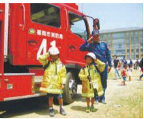
消防服を着て消防士になりきるう

午前10時半～午後0時半 所 花畑園芸公園 問 南消防署予防課 541-0219 F 552-8148 定 はしご車の試乗(5歳～小学生)は先着50人(午前10時20分から整理券を配布) 料 無料