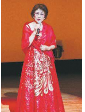
自慢の歌声を披露しませんか

南区市民の祭り文化祭「シニアのつどい(カラオケ祭り)」に出演しませんか。期 11月21日(火)午前9時50分～午後4時半 所 南市民センター文化ホール 問 区シニアクラブ連合会事務局(区福祉・介護保険課内) 559-5129 F 512-8811 函 区内に住む60歳以上の人 定 抽選40人(グループでの応募は不可) 料 無料 申 往復はがきに本紙14面の応募事項と歌う曲名(ふりがな)・歌手名を書いて10月25日(水)必着で同事務局(〒815-8501住所不要)へ。