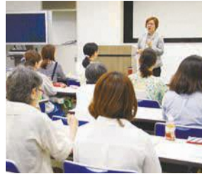
幅広い分野の講座を開講。関心のある講座が見つかるはず

☎4日(土)午後7～8時(開場午後6時半) ☎先着300人 ☎無料 ☎不要 ※①②③託児(6カ月～就学前。無料)希望の場合は10月26日(木)までに申し込みを。