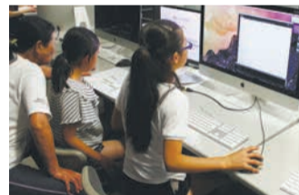
「子ども大学」でゲームのプログラミングに挑戦

区内の大学・短期大学の特色や学生の活力を生かして、区のまちづくりに取り組んでいきます。5月からは小学生が大学の専門分野を体験できる「南区子ども大学2017」を開講。秋には学生が作った雑貨や食べ物の販売、ものづくりのワークショップなどを行う七大学合同イベントを開催します。