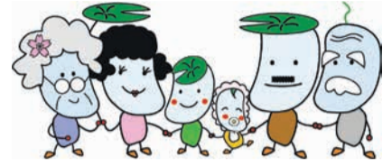
南区広報担当キャラクター ため蔵くんファミリー

区は「いきいき南区 暮らしのまち～身近な自然とふれあい みんながつながり支え合う～」を目指して、さまざまな事業に取り組んでいます。取り組みの一部を紹介します。なお、本年度の取り組みをまとめたリーフレット「南区の主な事業」を、区役所本館1階のコミュニティ情報コーナーで配布しています。区ホームページ(「福岡市 南区運営方針」で検索)でも閲覧できます。