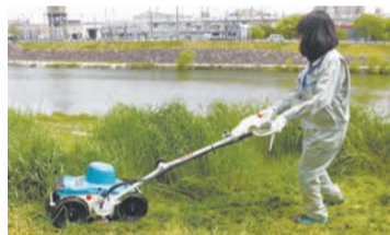
貸出時に使い方を説明します

公園の除草作業用の草刈り機などを無料で最大1週間貸し出します。今年から操作が簡単で静かな自走式電動草刈り機も導入。対象は、公園愛護会など市民5人以上で構成される地域のグループや企業などで、公園内で使用する場合に限りです。