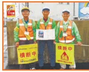
通学の見守り 6年間ありがとう

☎=日時、開催日、期間 ☎=場所 ☎=問い合わせ ☎=ファクス ☎=対象 ☎=定員 ☎=料金、費用 ☎=持参 ☎=託児 ☎=申し込み ☎=メール ☎=ホームページ