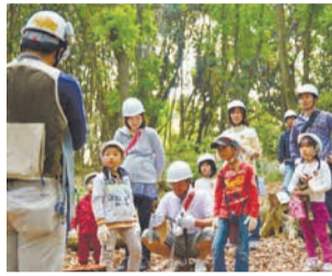
身近な自然に触れませんか

南区と中央区の境に位置する鴻巣山(こうのすやま)で、間伐(かんばつ)体験や間伐材を使ったオリジナルスプーン作りなどを行います。開7月24日(月)、7月27日(木)、8月7日(月)の午前9時~正午 所 南区役所集合・解散(バスで同山へ移動) 問 区企画振興課 ㊟559-5016 ㊟562-3824 対 小学生と保護者。*小学5・6年生は子どものみの参加も可 定 各回先着25組 料 無料 申 6月15日(木)から電話かファクス、メール(㊟373event@city.fukuoka.lg.jp)に本紙14面の応募事項を書いて同課へ。