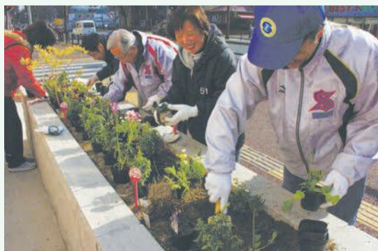
みんなで力を合わせ花壇の花を一新