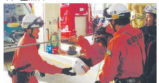
消防士になりきってレスキュー体験

☎午前10時～正午 ☑南消防署(塩原二丁目) ☑南消防署予防課 ☎541-0219 ☎552-8148 ☑はしご車の試乗(☑4歳～小学生)は先着50人(午前9時50分から整理券を配布) ☑無料