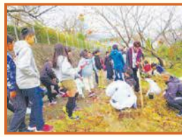
若久校区大坪隊員 「小学校にきれいな桜の花よ再び」を夢見て