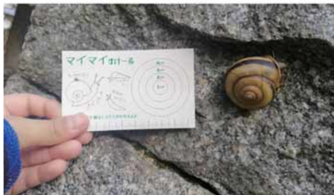
一緒に撮るとサイズが伝わりやすいグッズ「マイマイすけーる」

初めての取組み、市民参加型調査を行いました。対象は「かたつむり」。かたつむりを見つけたら写真を撮って、メール、Facebook、Twitterにて投稿していただきました。投稿はSNS上で共有し、トーク・カフェのゲストもお願いした、野島智司さんからコメントをいただきましたよ。どんなかたつむりがいたのか、報告は別紙に詳しくまとめています!