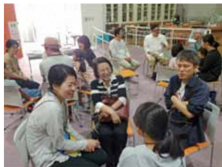
トークセッション