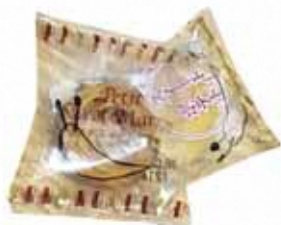
おやつは、ぐるぐるのモンブランにかたつむりを描きました♪

テーマに困んだおやつや、お茶を楽しみながら、参加者の間に自然な交流が生まれる楽しい時間です。その後のグループに分かれた トークセッション も話題が尽きず、盛り上がりました。