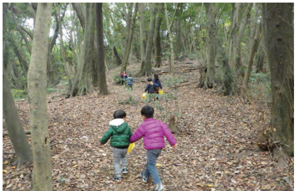
鴻巣山の森で自由に活動「こうのす山であそぼう会」