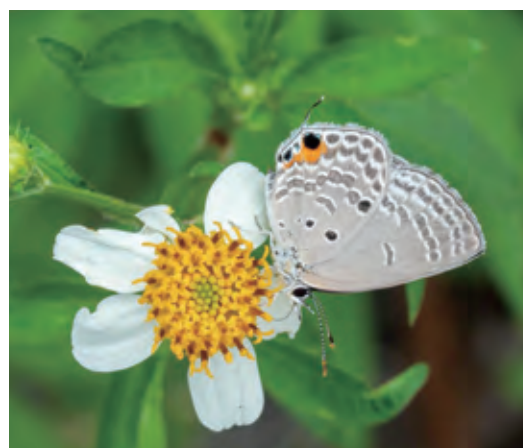
シジミチョウ見つけた！