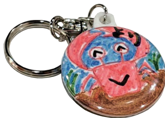
かわいくできました！