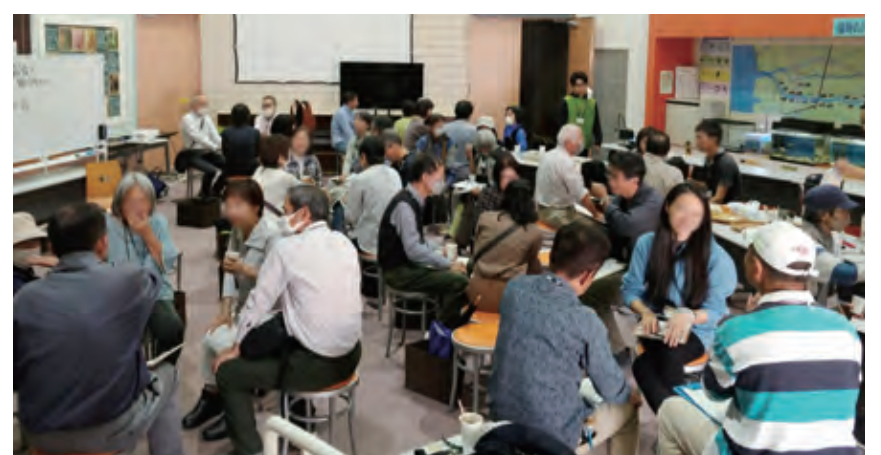
ケヤキの種と葉（上）／観察後の交流（下）