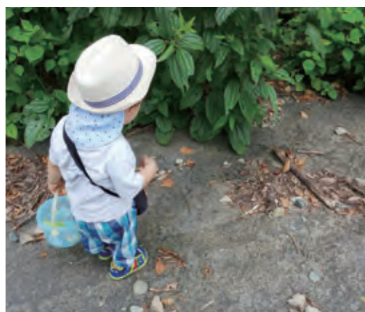
なにか発見した様子…