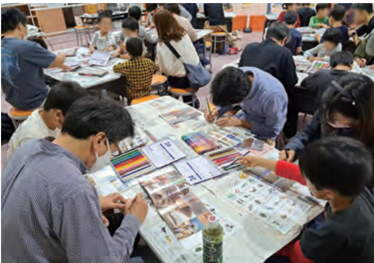
みんなで生きもののイラストを描いています