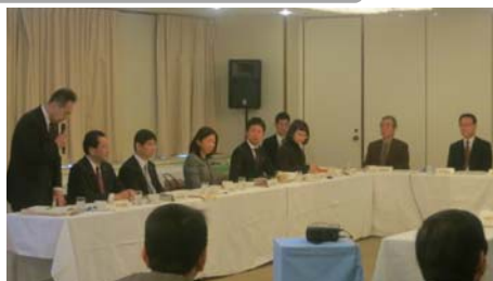
○開催あいさつ（馬場住宅都市局長）