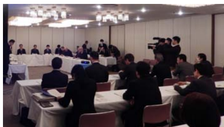
○検討委員会の様子