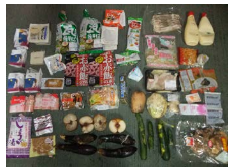
図 2 家庭系可燃ごみ約 200kg 中に確認された手つかず食品

家庭系可燃ごみ 200kg 中に含まれる手つかず食品の排出重量は約 7.81kg で、重量割合に換算すると 3.9%（平成 26 年度下半期は 4.0%、平成 27 年度は 3.8%）となった。平成 27 年度の家庭系可燃ごみ処理量（271,195 トン）及び本割合から同年度の家庭系可燃ごみ中の手つかず食品の重量を推定すると、約 10,305 トンとなった。また、分類毎の重量割合を見ると「果物・野菜類」の割合が多かった（約 4 割）。季節別に見ると 1～2 月の排出量が多かったが、