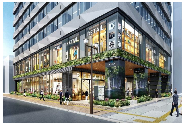
木質化された立体広場の軒天井

立体広場の軒天井、ホテルのロビー階、オフィスのエントランスにおいて、積極的に九州産の木材を利用し、CO2固定化による環境負荷軽減を目指します。また、建物屋上には太陽光発電設備を設置し、地球温暖化対策に貢献します。加えて、当社は、国際イニシアティブの RE100 に加盟しており、グループ会社全体の使用電力を 2024 年までに非 FIT 太陽光発電設備による 100%再生可能エネルギー化する計画を進めています。本計画につきましても、当社グループで運営するホテルを対象に再生可能エネルギー化を図り、電気由来の CO2 排出をネットゼロとすることを実現します。