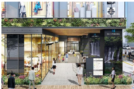
地上広場のイメージ

地上は明治通りとメルヘン通り交差点、地下は地下鉄天神駅コンコース最寄りになる箇所に立体広場を配置します。各交通機関と施設を立体的に結び、新たな地区ネットワークを構築し賑わい溢れる立体広場を整備します。