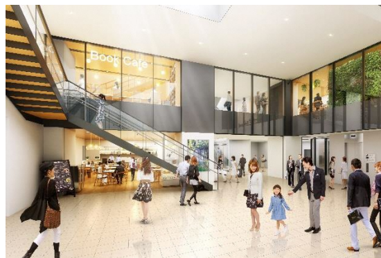
地下広場のイメージ