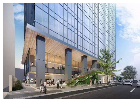
明治通り沿いエントランスイメージ

地下鉄天神駅と接続する本計画では、敷地の東側に大きなピロティ空間を計画します。また、敷地の西側にも大きな庇のある広場空間を創出します。これらの広場空間では温かみのある大きな木調の屋根により人々を出迎えます。また西側の広場には桜をシンボルツリーとして配し、交差点に四季の彩を加えます。広場空間には植栽と合わせてベンチなどの休憩施設を設け、人々の憩いの空間とします。