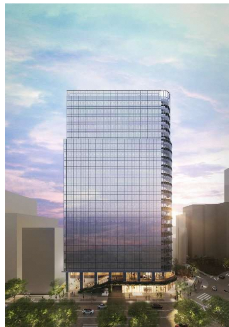
北側夕景イメージ

屈曲した道路の正面に、テナントが自由に使えるバルコニーを各フロアに設けます。地上広場、2階の大きなテラス、バルコニーと人々の活動の賑わいがビルの表情となり、活気にあふれる街である天神の西の象徴としてふさわしい景観を形成します。また足元部分には明治通りに沿って帯状に緑を設け、行きかう人の目に常に緑が触れる計画とし、歩行者に潤いを提供します。