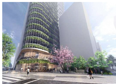
西側コーナーパークイメージ

福岡市が進める「感染症対応シティ」の実現に向け、基準階の事務室から直接出入りできるバルコニーや、地上広場、ピロティ空間、2階のテラスなどのオープンエアーの空間の整備、先行予約システム導入による非接触でのエレベーター呼び出し、地上地下の広場へのWi-Fi提供による通信環境の充実等に取り組み、ポストコロナに対応した安心安全なまちづくりの推進に努めます。