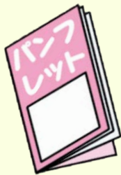
パンフレット・書籍