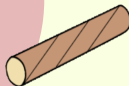
ラップ・アルミ・ トイレットペーパーなどの 紙の芯