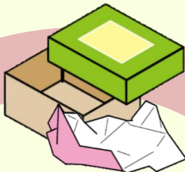
紙箱・包装紙 (お菓子・贈答品)