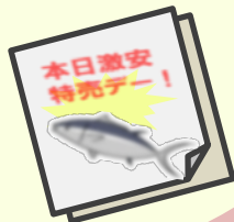
投函されたチラシ