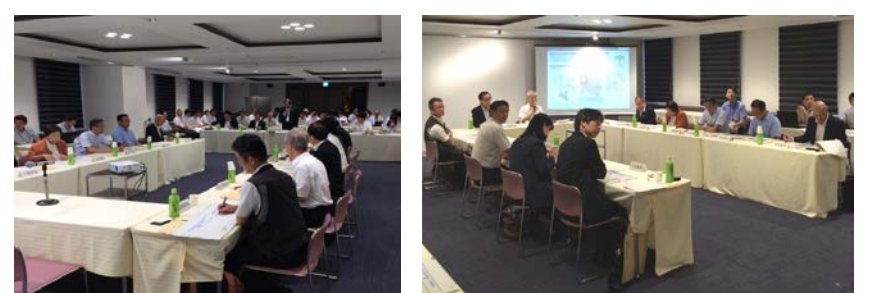
■委員会冒頭あいさつ (光山住宅都市局長) ■資料説明 (跡地について情報を共有しました)

第1回では、構想作りに際し、各委員から幅広くご意見を頂きました。(主な意見については右欄に記載しています。)