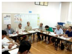
(まちづくり協議会)