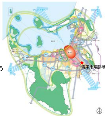
(将来の都市構造図)