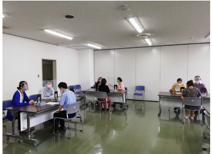
早良市民センター